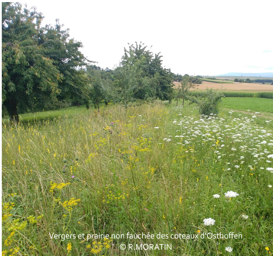
Vergers et prairie non fauchée des coteaux d'Osthoffen

Malgré un environnement agricole largement intensifié, le maintien à long terme de cette structure paysagère unique, fonctionnelle d'un point de vue écologique (conservation d'un maximum d'arbres morts ; parcelles noyaux conservatoires de prairies extensives ou prés-vergers) doit être réfléchi, en intégrant le corridor du Bruchgraben et la possibilité de connecter par un circuit pédestre "renaturé" Breuschwickersheim à Osthoffen via le passage à faune GCO.