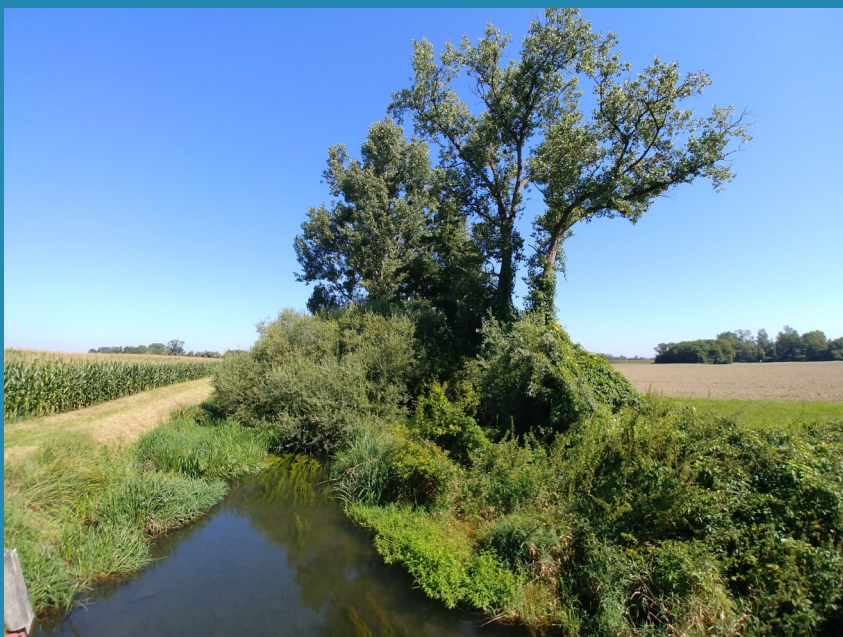
Haie en bordure du Rhin Tortu à Plobsheim en septembre 2021

Le corridor de l'Ill, en rive droite, entre les jardins familiaux de Illkirch et Eschau-Wibolsheim (site 6) couvre un paysage peu fréquenté, mais bénéficiant encore de ripisylves anciennes, de bosquets assez vastes, et de petits corridors de zones humides ou inondables, plus exceptionnellement de prairies (jardins familiaux). En complément des renaturations de zones humides déjà réalisées, la diversification de la trame boisée et du réseau de mares apparaît un enjeu fort, surtout dans un secteur sans circuits de promenade attractifs.