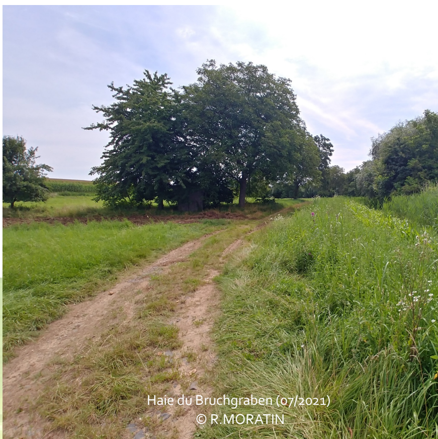
Haie du Bruchgraben (07/2021)