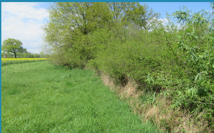
Haie du Niederrohrmatt à La Wantzenau en avril 2023

Un travail de sensibilisation pourra être mené pour résorber des pratiques d'agrainage ou de bûcheronnage documentées sur le site.