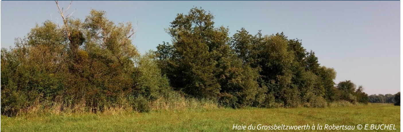
Haie du Grossbeltzwoerth à la Robertsau

Fiche action de l'Atlas de Biodiversité Intercommunale de l'Eurométropole de Strasbourg